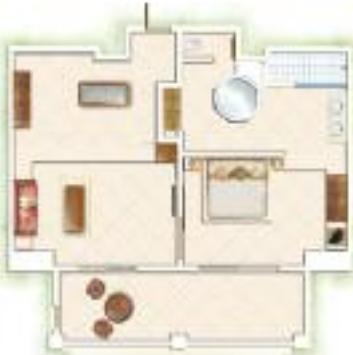
Suite Senior Senior Suite