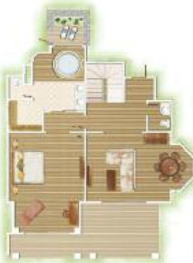
Suite Famille rez-de-chaussée Family Suite ground floor