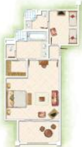
Appartement Famille Family Apartment