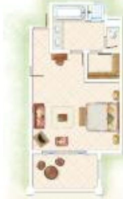
Chambre Deluxe Deluxe Room