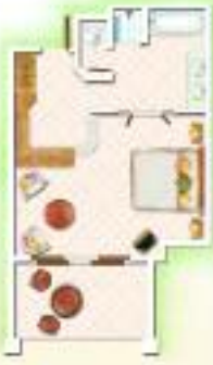
Chambre Supérieure Superior Room