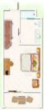
Chambre Standard Standard Room