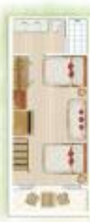
Loft 2 e Chambre 2 nd Room