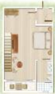
Loft Chambre principale Main bedroom